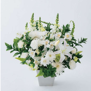
KF-999 籠花 15（一基） 19,800 円（税込）