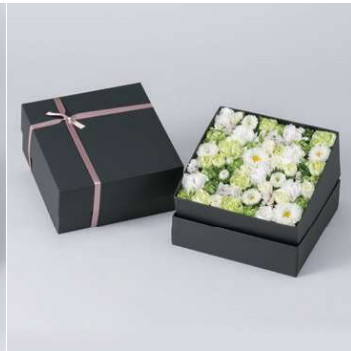
FB102B フラワーボックス黒 (中) W18×D18×H9cm 7,810円 (税込)