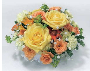
アレンジメント〈黄色・オレンジ系〉