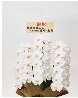
立札（後立てタイプ）横