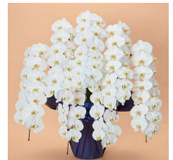
MO7006 プレミアム特選〈98輪以上〉 77,000円(税込)

記載の輪数は、つぼみ込みの輪数です。生花の特性上、時期によりつぼみの数が多い場合や、花の色の濃淡が異なる場合があります。