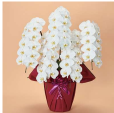
MO5003 特選〈55輪以上〉 45,100円(税込)