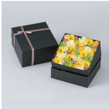
FB101B フラワーボックス黒 (小) W15×D15×H9cm 5,940円 (税込)