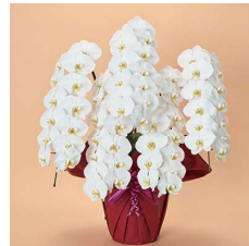
MO5005 プレミアム〈65輪以上〉 51,700円(税込)