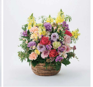
ARS15 手渡しアレンジメントフラワー 15 16,500円 (税込)