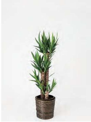
FP0802 ユッカ 8号 高さの目安：約 100～120cm 13,200円 (税込)