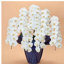
MO7004 上特選〈84輪以上〉 69,300円(税込)