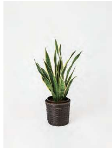
FP0805 サンセベリア 8号 高さの目安：約 80～100cm 13,200円 (税込)