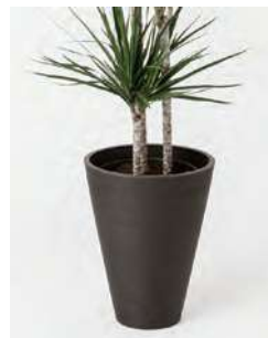
8号用 +2,200円 (税込)