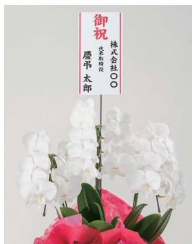
立札（後立てタイプ）縦