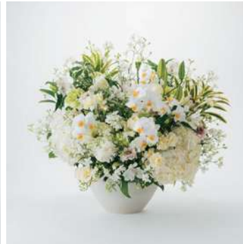
ARS30 手渡しアレンジメントフラワー 30 33,000円 (税込)