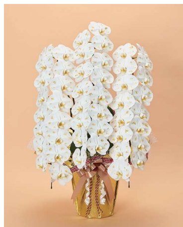
特別サイズ・金箔蘭 3本立 (48輪)