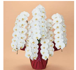
MO5006 プレミアム特選〈70輪以上〉 55,000円(税込)