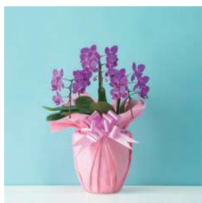
MO1301 コスモレディ（赤・ピンク系）