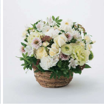
ARS10 手渡しアレンジメントフラワー 10 11,000円 (税込)