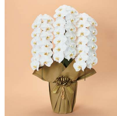
MO3005 プレミアム〈39輪以上〉 33,000円(税込)