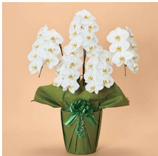
MO5001 〈35輪以上〉 38,500円(税込)