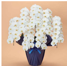
MO7003 特選〈77輪以上〉 64,900円(税込)