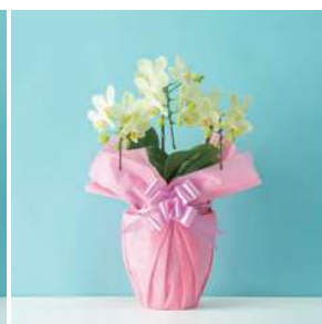
MO1304 グリーンピクシー（黄色系）