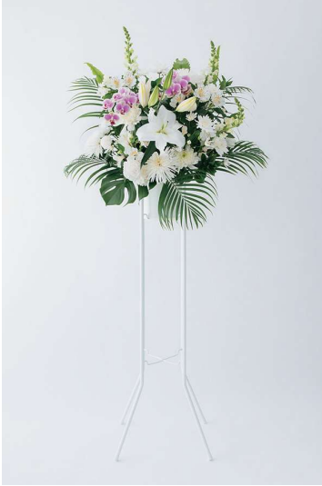
KF-001 供花 15（一基） 19,800 円（税込）

供花 | 一段と二段のものがああります（お届け先の地域により、どちらかしか受け付けられない場合があります）。