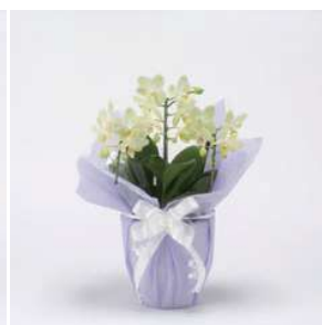
MO1314 グリーンピクシー (黄色系)