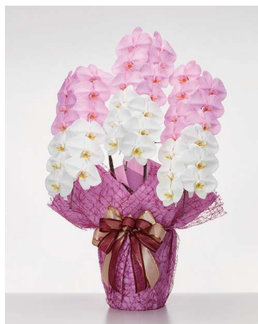
色付き胡蝶蘭 (白・ピンク) 3本立 (39輪)