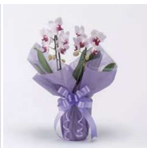
MO1213 リトルジェム (赤・ピンク系)