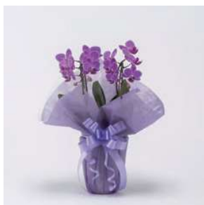
MO1211 コスモレディ (赤・ピンク系)