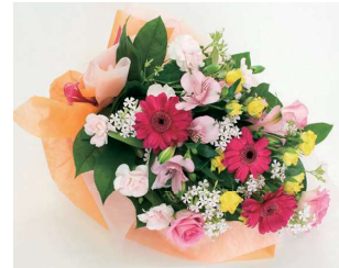
花束〈色ミックス系〉