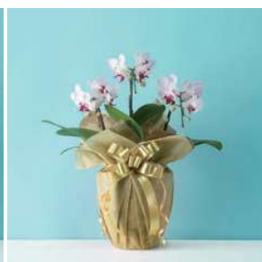
MO1303 リトルジェム（赤・ピンク系）