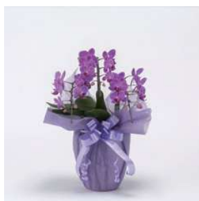
MO1311 コスモレディ (赤・ピンク系)