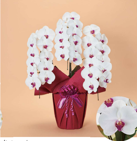
赤リップ 花の中心が赤く色づいた赤リップ。紅白の組み合わせが縁起のよい印象を与えます。