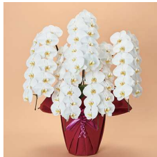
MO5004 上特選〈60輪以上〉 49,500円(税込)