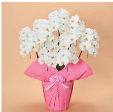
MO7001 〈49輪以上〉 57,200円(税込)