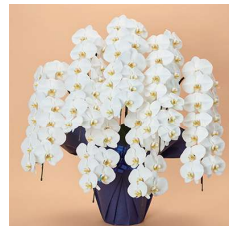
MO7005 プレミアム〈91輪以上〉 73,700円(税込)