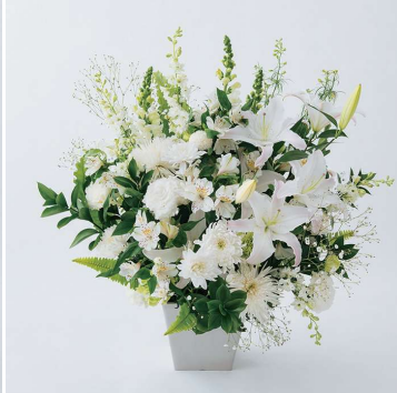
KF-998 籠花 20（一基） 27,500 円（税込）