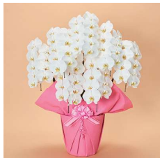
MO7002 上級〈63輪以上〉 60,500円(税込)