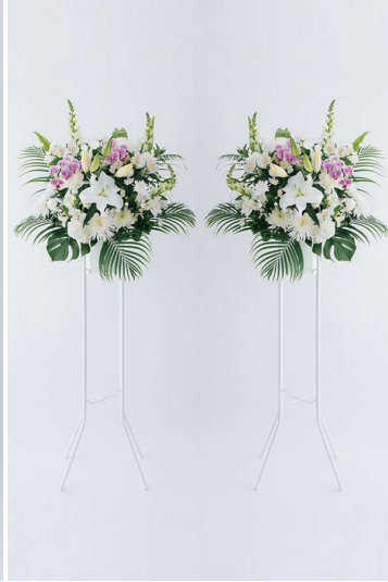
KF-007 供花 30（二基一対） 39,600 円（税込）