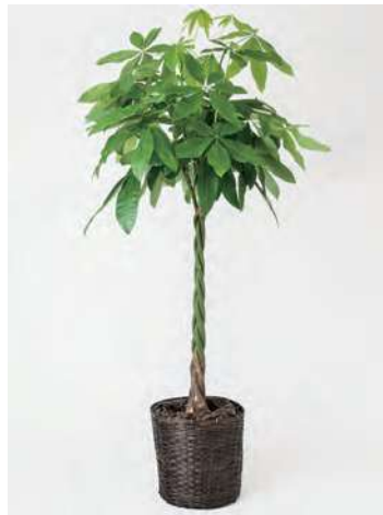
FP1003 パキラ 10号 高さの目安：約 150～170cm 19,800円 (税込)