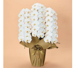
MO3006 プレミアム特選〈42輪以上〉 36,300円(税込)