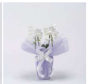
MO1215 ブランシュ (白系)