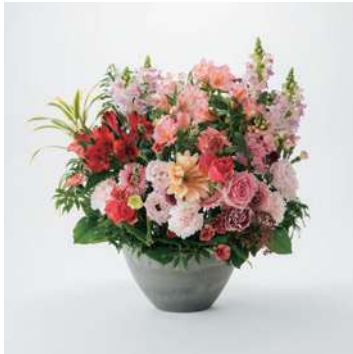
ARS20 手渡しアレンジメントフラワー 20 20,000円 (税込)