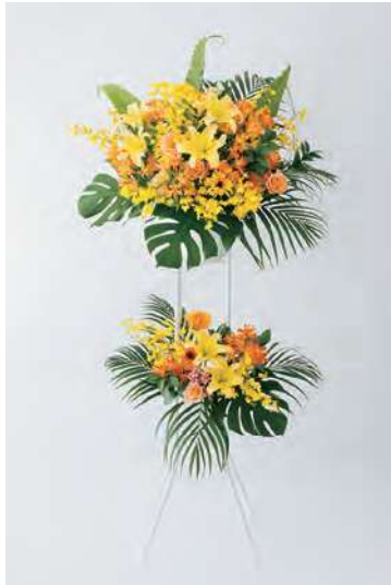
〈黄色・オレンジ系〉