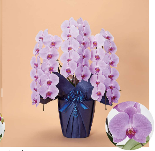
ピンク 優しい印象のピンクは、お部屋やオフィスを華やかに彩ります。