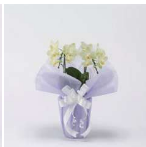
MO1214 グリーンピクシー (黄色系)