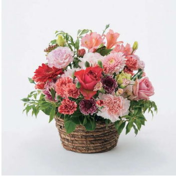
ARS05 手渡しアレンジメントフラワー 05 5,500円 (税込)