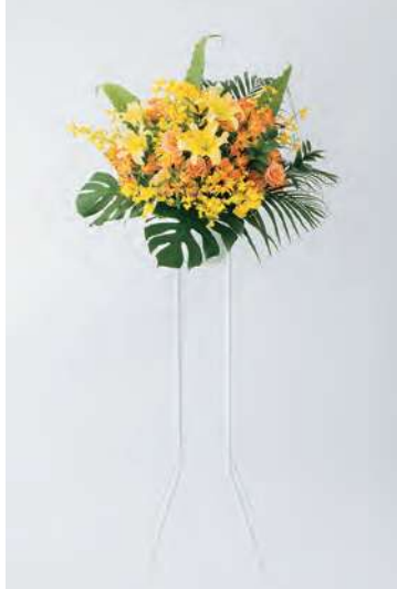
〈黄色・オレンジ系〉