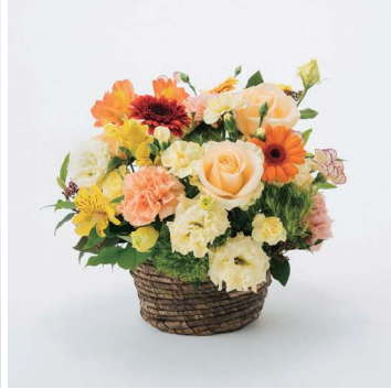
ARS08 手渡しアレンジメントフラワー 08 8,800円 (税込)