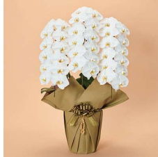
MO3004 上特選〈36輪以上〉 29,700円(税込)