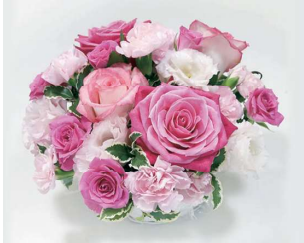
アレンジメント〈ピンク・赤系〉