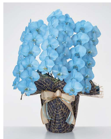
色付き胡蝶蘭 (ブルー) 3本立 (36輪)