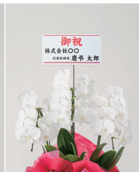
立札（後立てタイプ）横