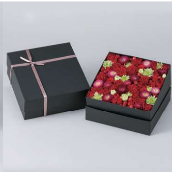
FB103B フラワーボックス黒 (大) W20×D20×H9cm 9,900円 (税込)