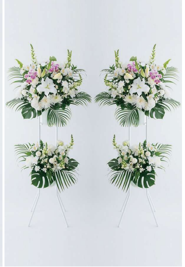
KF-008 供花 40（二基一対） 55,000 円（税込）