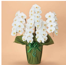
MO5002 上級〈45輪以上〉 41,800円(税込)