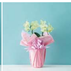
MO1204 グリーンピクシー（黄色系）