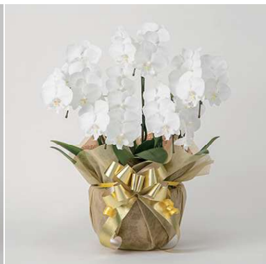
MO2002 5本立 15,400円(税込)