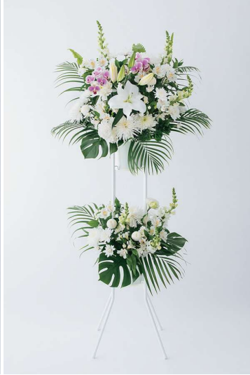
KF-002 供花 20（一基） 27,500 円（税込）