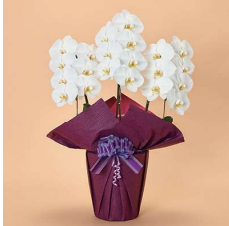
MO3001 〈21輪以上〉 20,900円(税込)