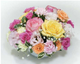
アレンジメント〈色ミックス系〉