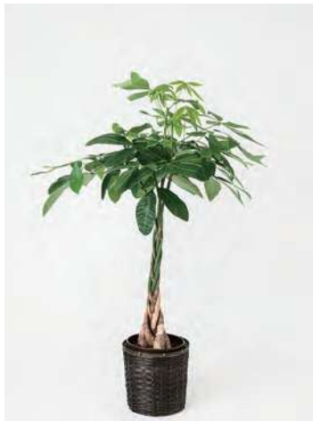
FP0803 パキラ 8号 高さの目安：約 90～110cm 13,200円 (税込)