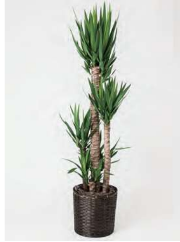
FP1002 ユッカ 10号 高さの目安：約 160～180cm 19,800円 (税込)