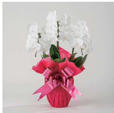
MO2001 3本立 10,780円(税込)