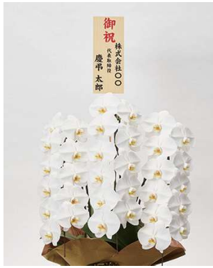
立札（後立てタイプ）縦