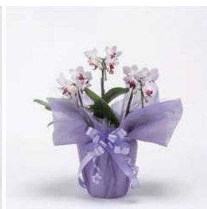
MO1313 リトルジェム (赤・ピンク系)