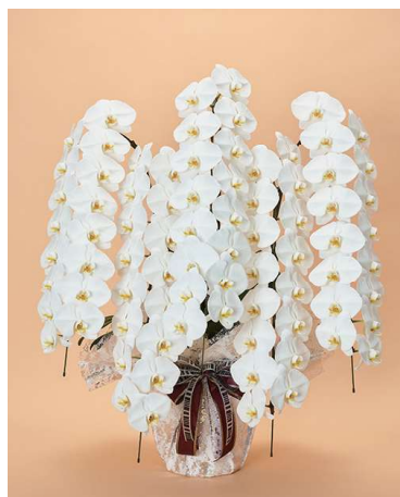
特別サイズ 5本立 (80輪)