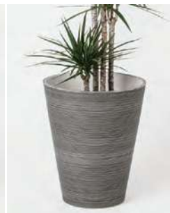
10号用 +3,850円 (税込)