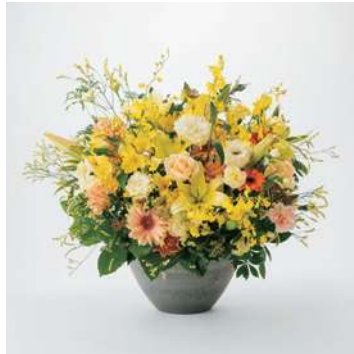
ARS25 手渡しアレンジメントフラワー 25 27,500円 (税込)