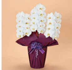
MO3002 上級〈27輪以上〉 24,200円(税込)