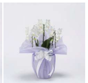
MO1315 ブランシュ (白系)