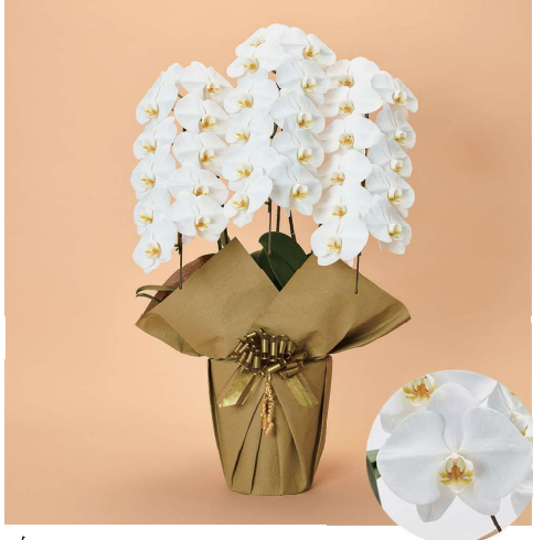
白 上品で格式高いイメージの白は、ビジネスシーンでの定番カラーです。