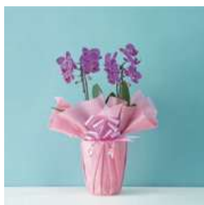
MO1201 コスモレディ（赤・ピンク系）