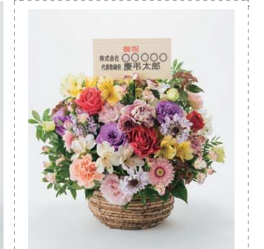
10 ~ 30 は 立札も選択できます。