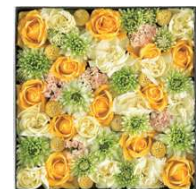
〈黄色・オレンジ系〉