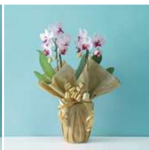
MO1203 リトルジェム（赤・ピンク系）