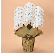
MO3003 特選〈33輪以上〉 26,400円(税込)